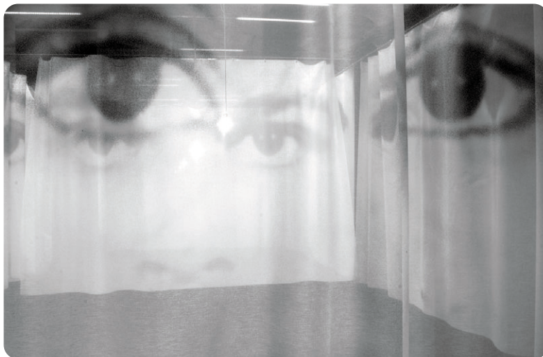
Christian Boltanski - Regards, 2013

Lorsqu'on va voir une exposition, on s'attend à regarder des œuvres, à sillonner des galeries en s'arrêtant devant une peinture qui nous attire, une sculpture qui nous intrigue... Avec Christian Boltanski au Musée des arts contemporains du Grand-Hornu, cet attendu est totalement secoué. L'artiste nous plonge tout entier dans une expérience profonde en émotions. À éprouver sans hésiter.