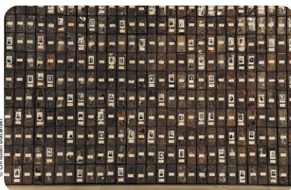
Christian Boltanski - Les Registres du Grand-Hornu